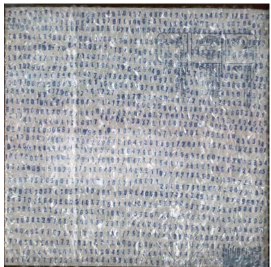
artwork by christian müller, switzerland

wir sind nur produkte. produkte der menschheit.