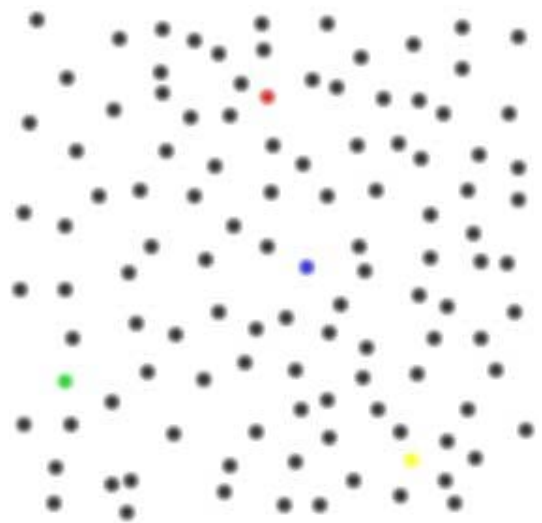
artwork by benjamin mündörfer, germany