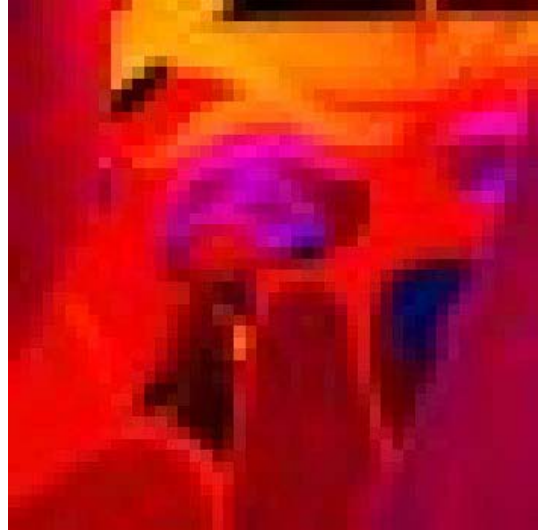
artwork by tanja dombrowski, germany

fortschritt: die tugend. rückschritt: der tribut.