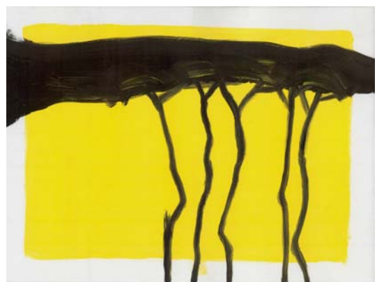
artwork by tesa tanasic, germany

er schlägt alle nieder: saurer regen. gift fuer die menschheit, selbstzerstörungsmechanismus.