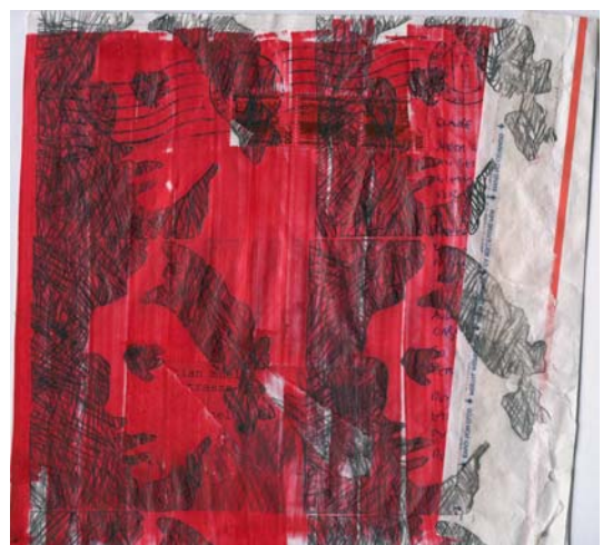
artwork by christian müller, switzerland

der obligatorische glaube: ein heiligtum, für jeden einzelnen, der masse.