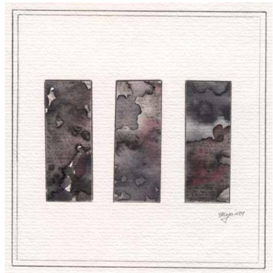
artwork by pirjo kongo, estonia

krieg, als mittel, zum zweck, ohne erfolg.