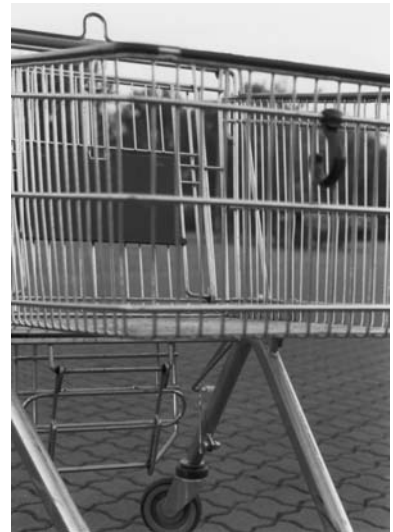
artwork by johanna voigt and benjamin mündörfer, germany

konsum, um uns herum, das ultimative visum, zum individuum.