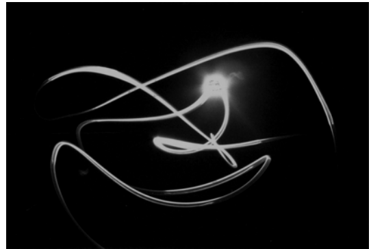
artwork by melanie broome, germany

ob mechanisch, geistig oder virtuell, energie zeigt sich individuell.